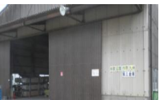
渡辺製作所 第三倉庫