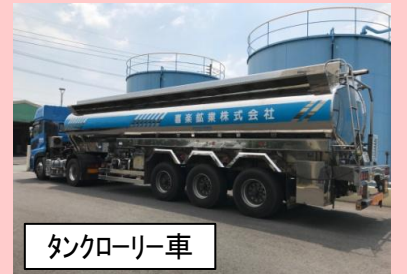
タンクローリー車