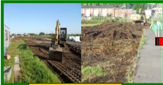
先月までの進捗状況。