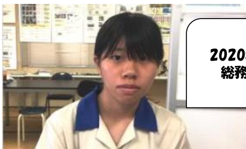
2020年新入社員 総務配属予定